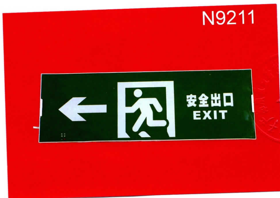
产品型号: N-BLJD-1LR0EIII2WJDD (图 B. 1+图 B. 5)