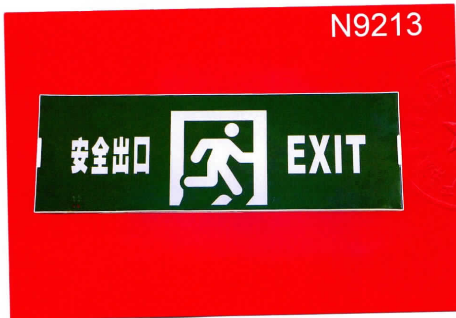
产品型号: N-BLJD-1LR0EIII2WJDD (图 B. 2)